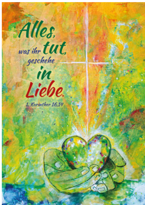
Acryl von U. Wilke-Müller